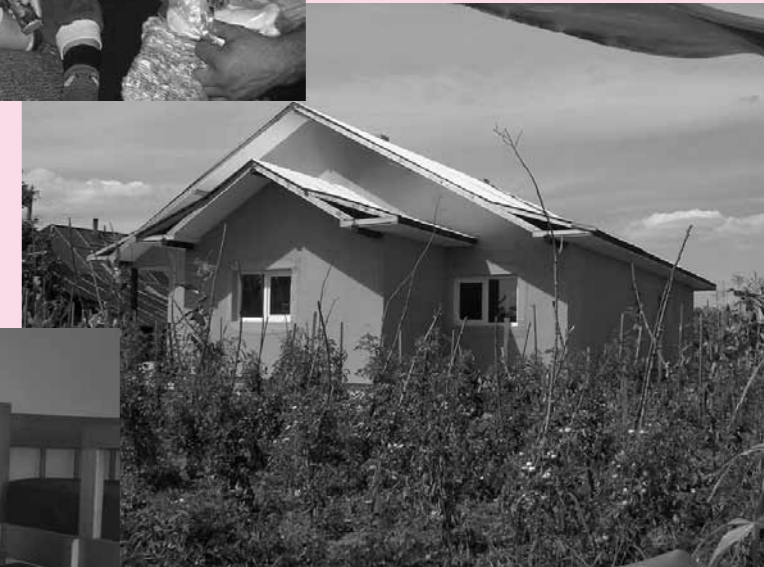
Zwei Familien freuen sich auf das neue Zuhause!